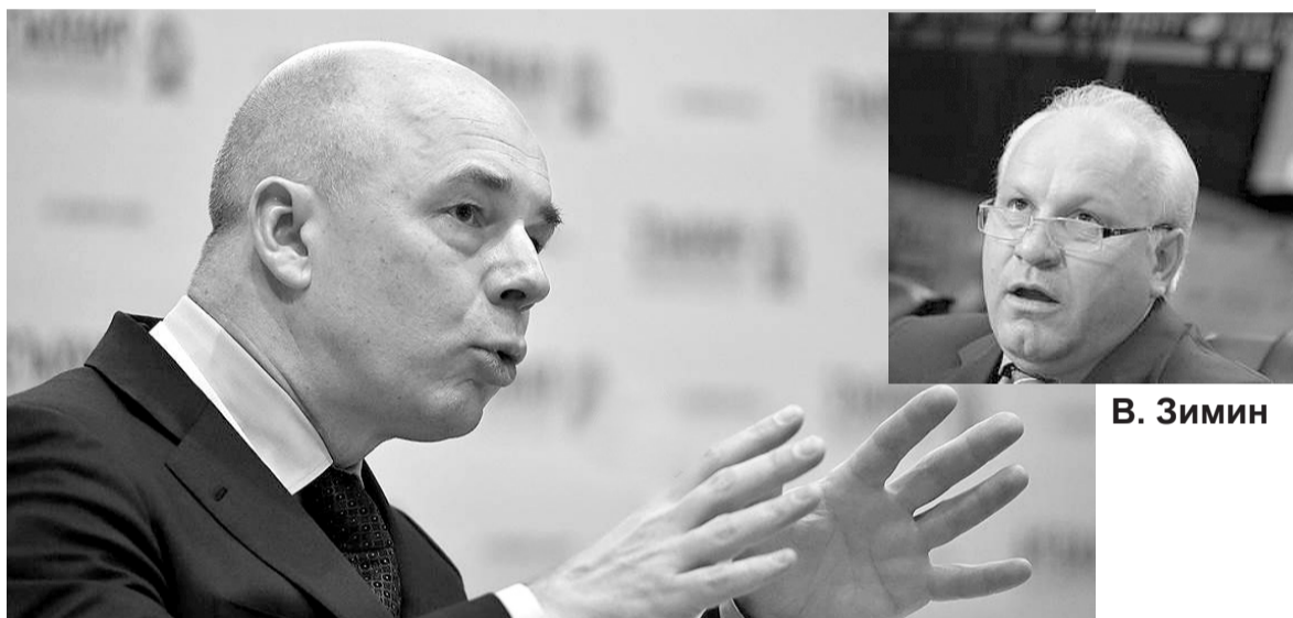
Министр финансов России А. Силуанов

А, в случае дефолта, огромные потери федерального бюджета от невозврата многомиллиардных бюджетных кредитов, которыми Правительство Зимина оплатило долги в коммерческих банках — это