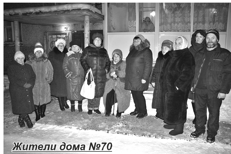
Жители дома №70

димо, проверил и сравнил, и сравнение – не в пользу «Кедра». Передача дома №70 «Кедру» приостановлена, материалы переданы в правоохранитель-