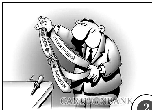
Без чиновников прожить можно